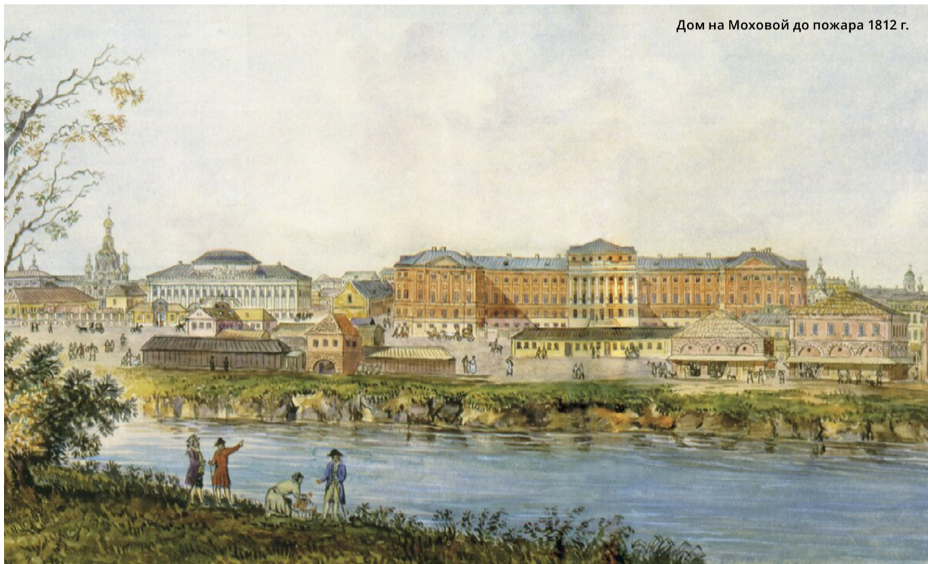
Дом на Моховой до пожара 1812 г.

Цокольный этаж предназначался для хозяйственных и служебных целей. Следующий считался первым, и вплоть до 1812 г. там располагалась университетская гимназия. Второй этаж был главным и именовался бельэтажем, отличаясь парадностью оформления. Композиционным центром этого этажа стал большой полукруглый Актный зал с великолепной колоннадой ионического ордера, расписным куполом и скульптурным фризом, опоясывающим зал. В представлении М. Ф. Казакова этот зал ассоциировался с «храмом мудрости». Доминирующую роль в нем играла ротонда с «апсидой», похожей на алтарь, на который ученые «приносят плоды» своих трудов. Не случайно в Актном зале университета никогда не устраивалось ни спектаклей университетского театра, ни маскарадов, ни танцев. Здесь проходили только актывые торжества и церемонии награждения отличников. С Актным залом перекликались круглые залы-ауди-